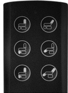
Fernbedienung für elektrische Verstellung ohne Aufstehhilfe

Hierfür die entsprechende Taste an der Handbedienung solange gedrückt halten, bis die gewünschte Position des Beinteils erreicht ist. Der Rücken bewegt sich je nach der gedrückten Taste nach vorne oder nach hinten. Hierbei gibt es eine netzabhängige und eine netzunabhängige Variante mit Akku.